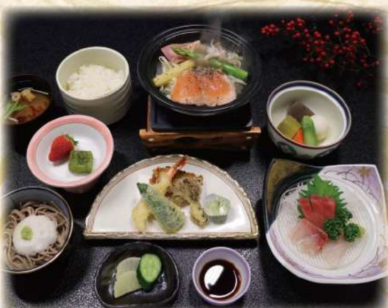
団体様専用 和食膳 2,200円(税込2,420円) 刺身・天ぷら・煮物・陶板焼・とろろそば ご飯、味噌汁、お新香・デザート

団体様専用『和食膳』大好評！ 団体様用メニューは1,870円(税込)～ご予算に合わせて承ります。