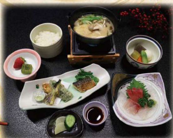
団体様専用 和食膳 1,700円(税込1,870円) 刺身・天ぷら・煮物・焼物・味噌汁(うどん入) ご飯、お新香・デザート