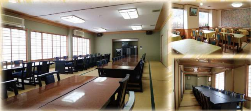
150席全てのお席を椅子席をご用意しております。