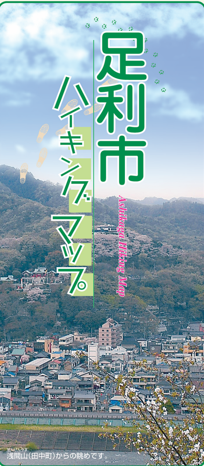
浅間山(田中町)からの眺めです。