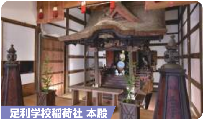
足利学校稲荷社 本殿

足利学校創建時から祀られていた稲荷社は、「学問の聖地 足利学校」を守り、伝えた学問の守り神です。今は、「学業成就・合格祈願」を願い、多くの方が参拝に訪れています。