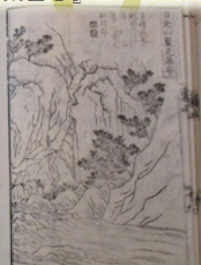
日光山裏見瀑布『山水奇観』