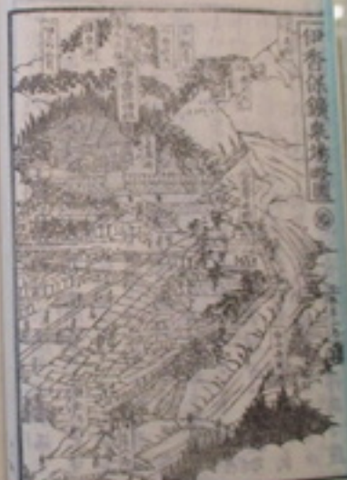
伊香保鑛泉場略図『伊香保鉦泉圖會』