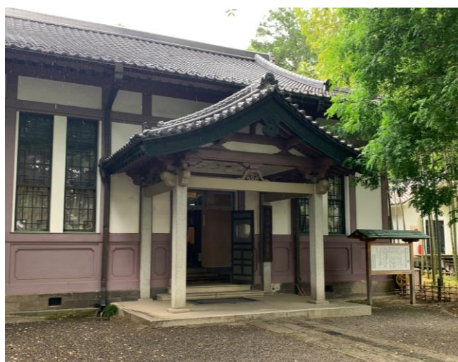
▲ 足利学校遺蹟図書館(史跡足利学校内)

電 車／東武伊勢崎線 足利市駅から徒歩約15分 JR両毛線 足利駅から徒歩約10分 車 ／東北自動車道 佐野藤岡ICから40分 北関東自動車道 足利ICから15分